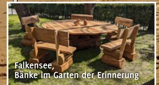
Falkensee, Bänke im Garten der Erinnerung