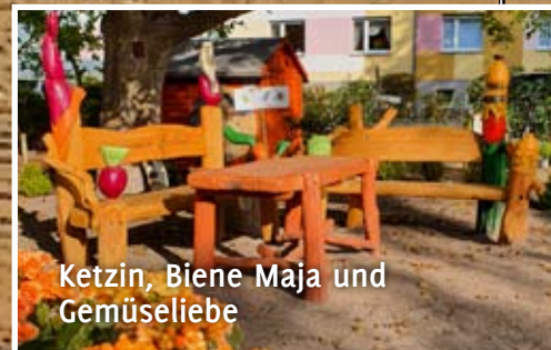
Ketzin, Biene Maja und Gemüseliebe