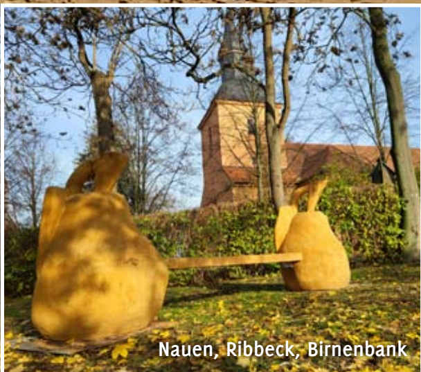
Nauen, Ribbeck, Birnenbank