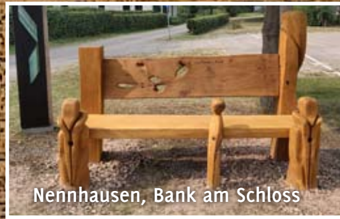
Nennhausen, Bank am Schloss