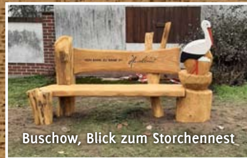
Buschow, Blick zum Storchennest