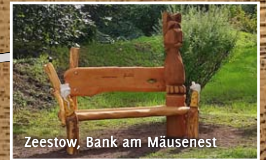
Zeestow, Bank am Mäusenest