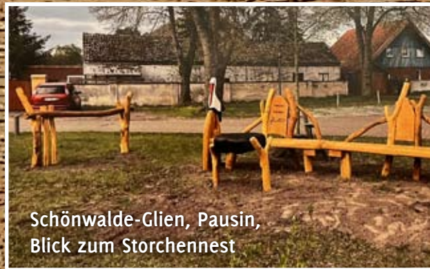
Schönwalde-Glien, Pausin, Blick zum Storchennest