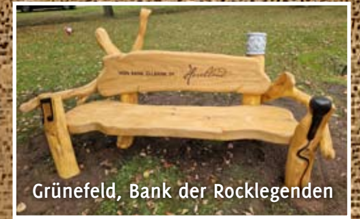
Grünefeld, Bank der Rocklegenden