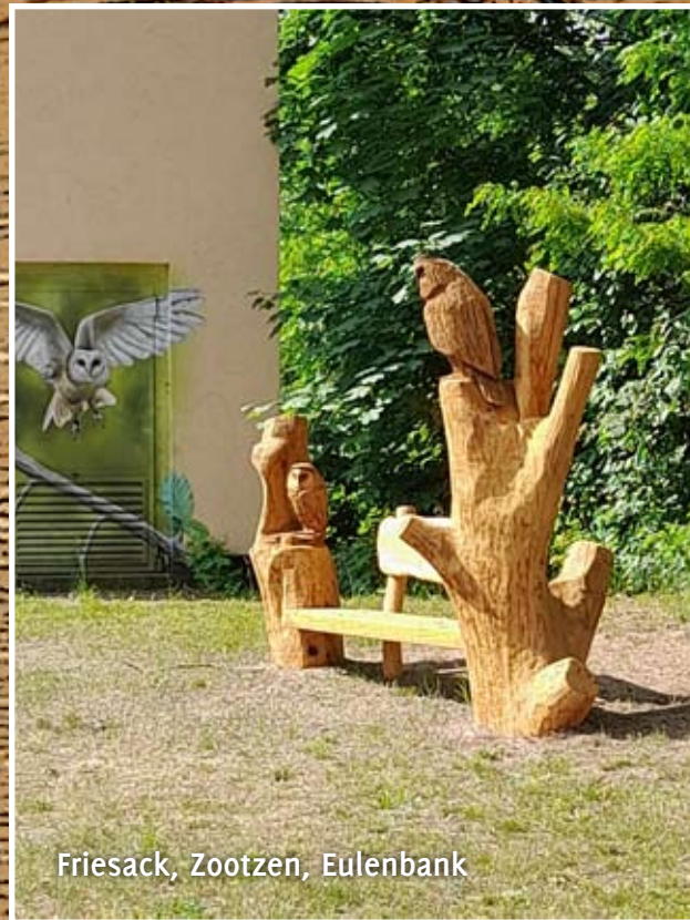
Friesack, Zootzen, Eulenbank